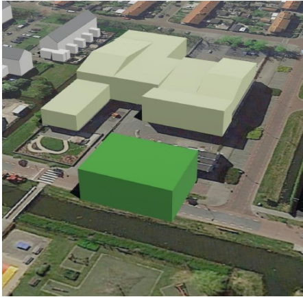
Schets scenario op het Middenpad