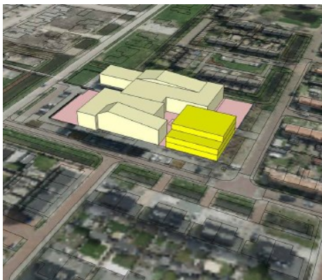
Schets scenario programma in één gebouw